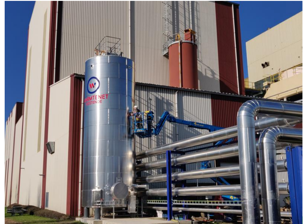
Warmtenet Oostende - Beauvent

https://www.inspiratiekaartwarmtezonering.be/info-page#info1