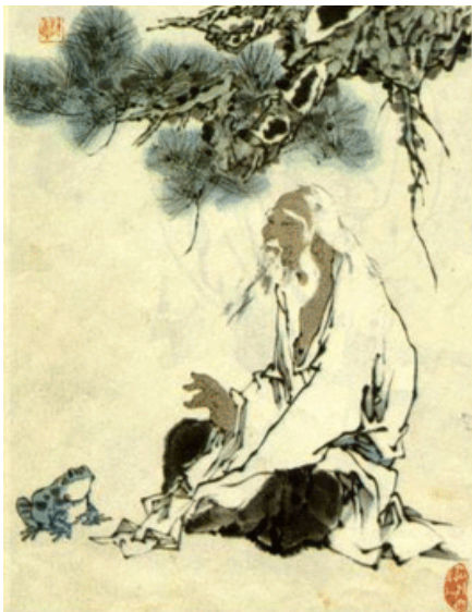
Een Chinese overpeinzing rond reizen

'Zeldzaam zijn diegenen die weten wat reizen werkelijk betekent. Men proeft de hernieuwing van de dingen maar men vergeet de herbronning in zichzelf. Je zet je in voor je rondreizen maar zonder kennis te hebben van wat je allemaal in jezelf zou kunnen beschouwen.'