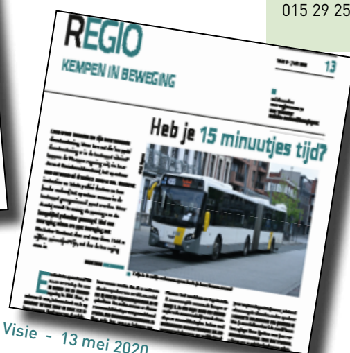
Visie - 13 mei 2020