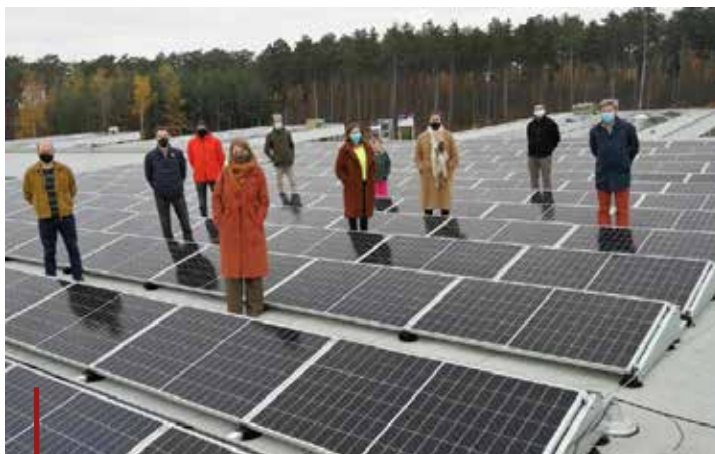
Campina Energie voorzag het dak van woonzorgcentrum Sint-Anna in Herentals van zonnepanelen.