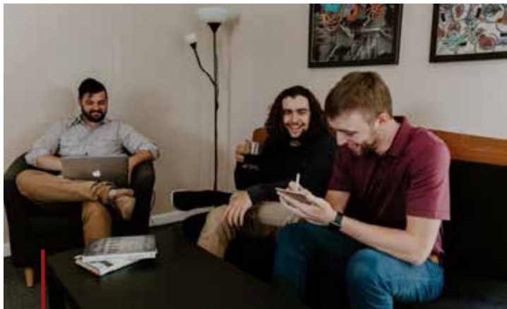
Burgers denken mee na hoe we zelf de CO2 uitstoot kunnen verminderen.