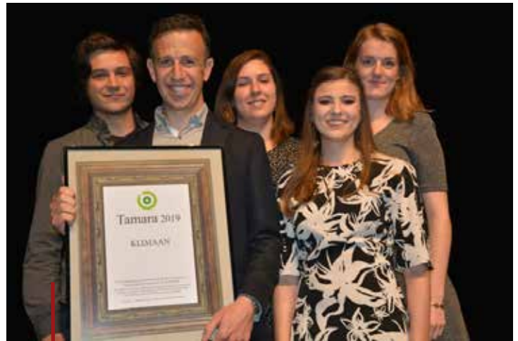
Klimaan was de eerste laureaat van de TAMARA's tijdens de RN-viering 2019