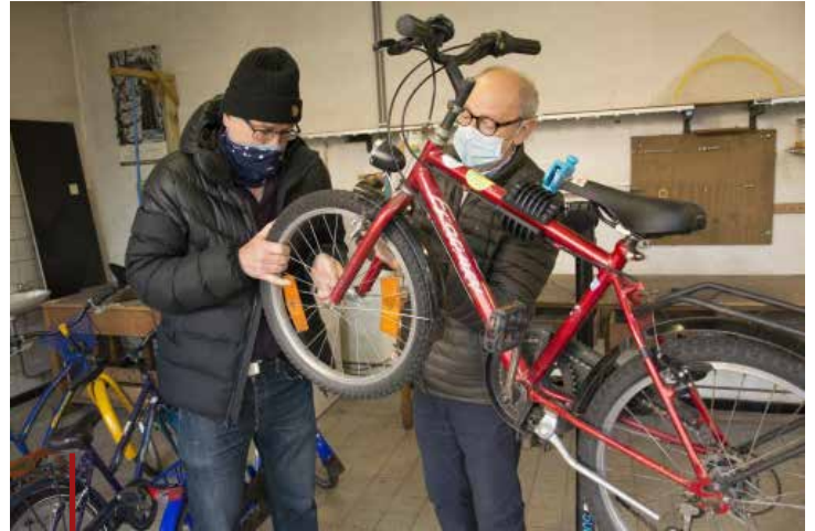
De vrijwilligers van de Fietsbieb Herentals gingen er van de eerste dag stevig tegenaan.

Oud-Turnhout, Merksplas, Hoogstraten, Vorselaar, Herselt en Herentals. In de regio Mechelen: Bonheiden-Rijmenam en St. Katelijne Waver. Maar daar blijft het niet bij. In diverse gemeenten is de interesse groot om met een fietsbieb te starten. Tot nog toe werden meer dan 750 kinderfietsen ontleend. Om dit perfect te laten verlopen staan zo'n 100 vrijwillige medewerkers een of meermaals per maand paraat. Meer info op: www.fietsbieb.be