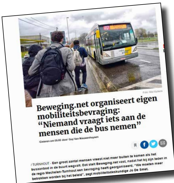
Gazet van Antwerpen - 30 juni 2020